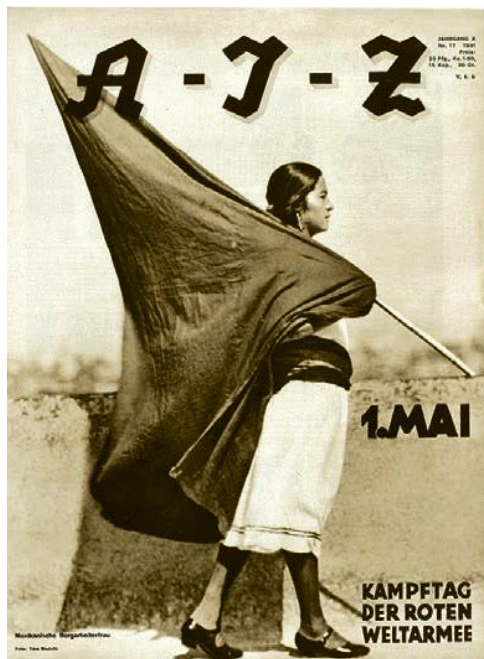
Tina Modotti AIZ : Journal illustré des travailleurs, n° 17 1931