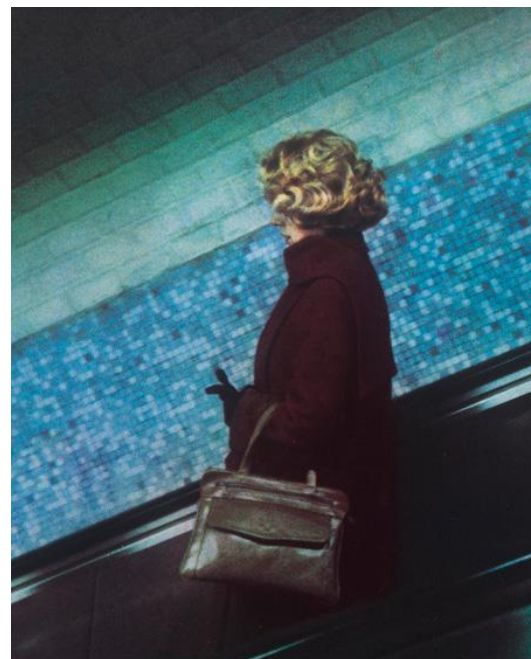
Dolorès Marat, La femme aux gants, 1987

Maison Européenne de la Photographie, jusqu'au 26 mai