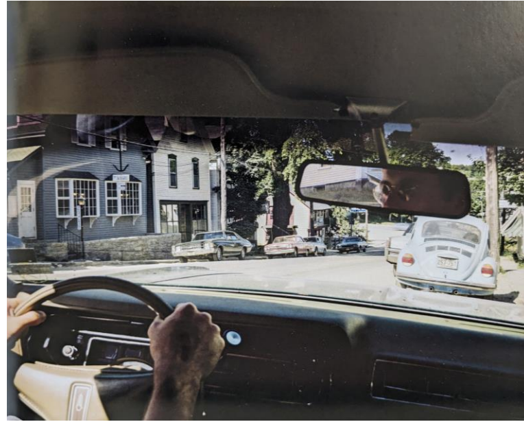
Main Street, Blue Hill, Maine, July 26, 1974, de la série Uncommon Places, 1973-1986