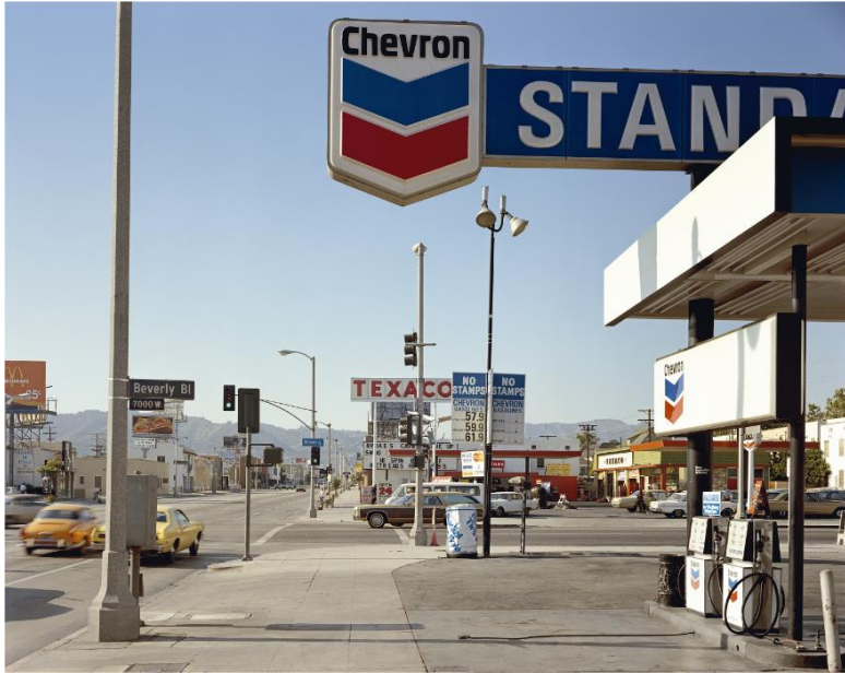
Beverly Boulevard and La Brea Avenue, Los Angeles, California, June 21, 1975, de la série Uncommon Places, 1973-1986