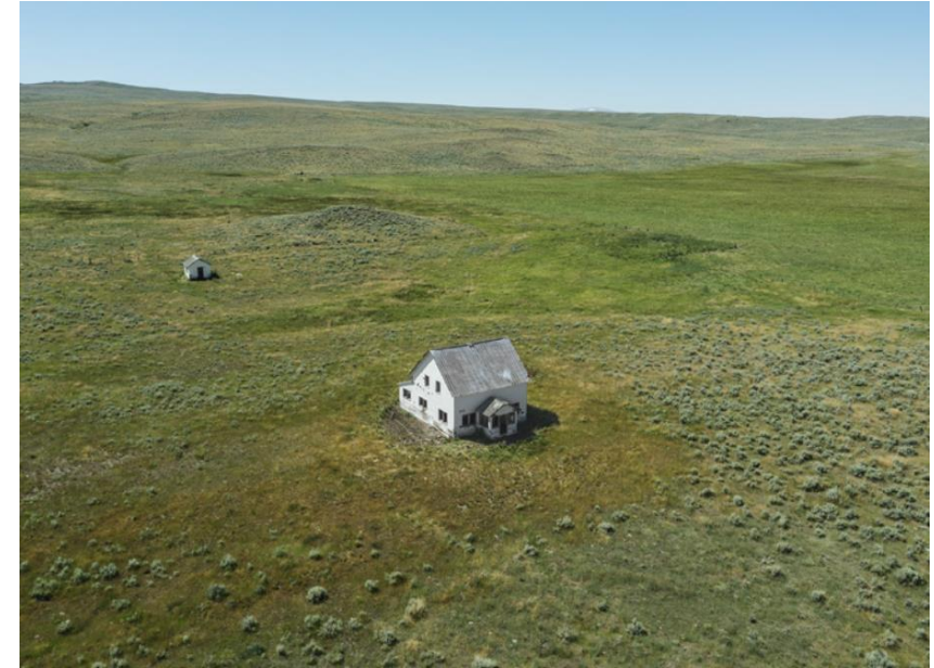
Meagher County, Montana, July 26, 2020 46° 11.409946N 110° 44.018901W, de la série Topographies, 2020-2021