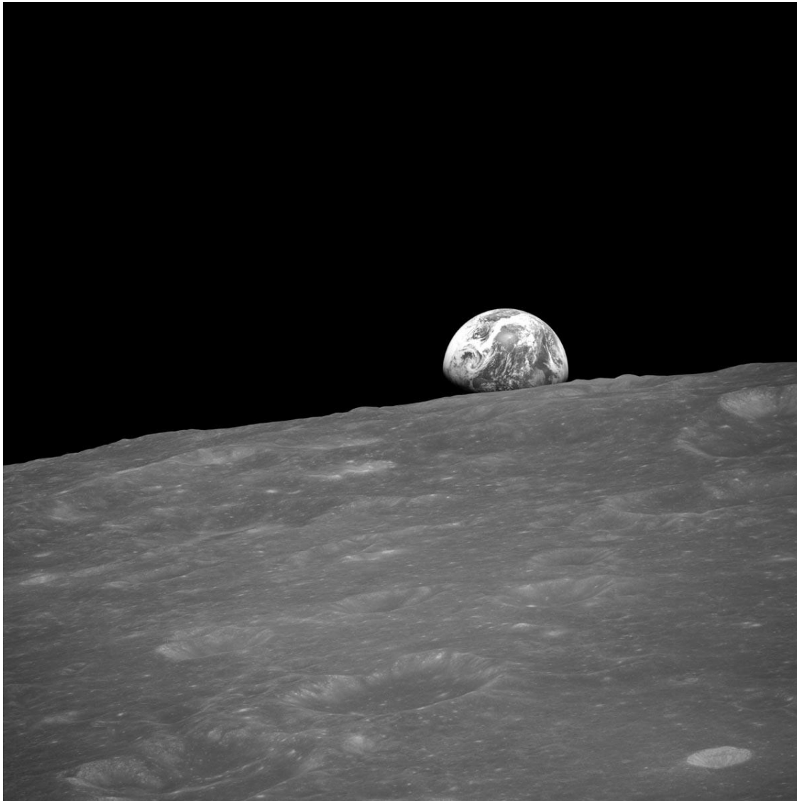
William Anders, Apollo 8, 24 décembre 1968 Hasselblad 250mm, film noir & blanc